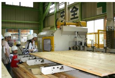
普段見られない材木の加工現場は 子供も大人も楽しめますよ!!

南砺市(旧福野町)にありますチューモクプレカット工場。約8,500坪の敷地に「柱材加工機」「横架材加工機」「羽柄材加工機」といった加工機が並び、約2500坪/月の建方材の加工が可能。CADデータに変換したお客様の設計図をコンピュータが自動的に、かつ高精度に加工します。その加工工程を実際にご覧になりませんか? 自社にて製材～加工～建築まで一貫して対応できるチューモクの責任施工の流れをご案内いたします。