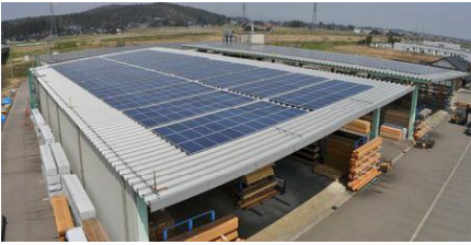
プレカット工場の屋根には 490kw 1960枚の太陽光パネルを 設置しております。